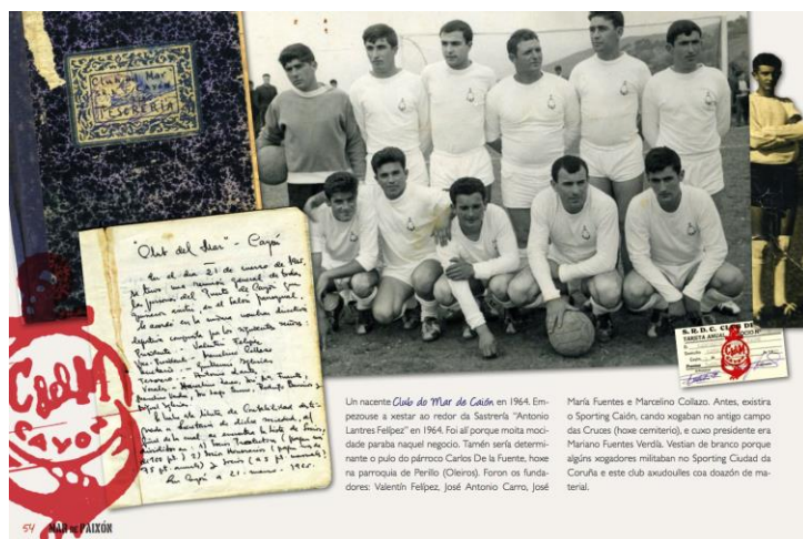
Página interior. Pose, H. y Porto, L. (2013). Mar de Paixón. O fútbol na Costa da Morte. Malpica .

salpimentamos la obra con menciones a entidades ciudadanas de carácter sociocultural; de sellos de los fotógrafos en los reversos de las fotos (en cierta manera, un homenaje a su labor de notarios de la cotidianidad); de portadas de libros que abordan la Costa da Morte desde múltiples géneros literarios o poner en valor la creatividad de artistas que viven o crean en este territorio del noroeste galaico. Más de treinta artistas plásticos cedieron una obra para ilustrar el volumen, en un doble intento de diversificar la mirada sobre ese territorio y amplificar la estética del libro.