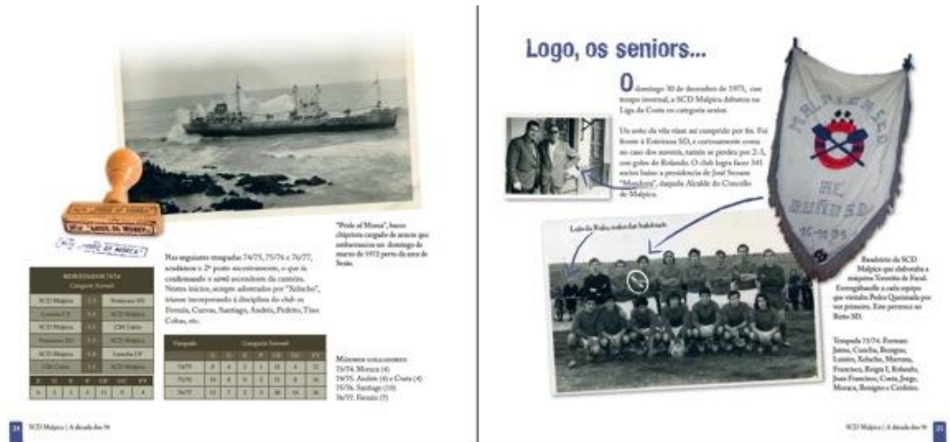
Naufragios, clasificaciones, objetos, personajes locales y un equipo en 1974. SCD Malpica, 40 anos de fútbol . Malpica: SCD Malpica.

de trabajar por lo procomún es un regalo para la memoria colectiva; cabe poner en valor los recursos comunitarios como soportes legitimadores de conocimiento y plusvalía social; aquello que se vive rebozado de emoción queda fosilizado en el imaginario íntimo y comunitario. Y genera un posicionamiento crítico y proactivo. Seguramente no fue la causa principal pero sin duda sí fue el revulsivo. Tras esta iniciativa, se procedió al cambio de directiva y la imagen del club mejoró entre los suyos. El apego social no se logra aumentar considerablemente con una publicación, que duda cabe, pero ayuda al echar la vista atrás en positivo, repensar el itinerario recorrido y balizar correctamente el camino futuro por transitar.