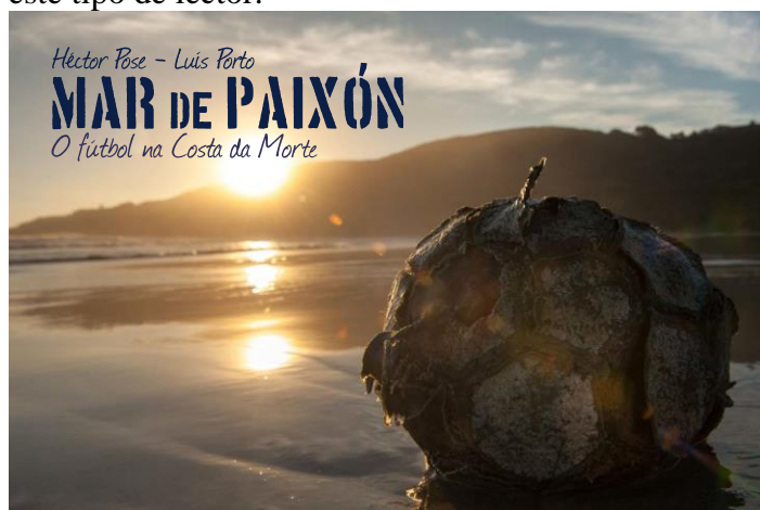
Portada. Pose, H. y Porto, L.(2013). Mar de Paixón. O fútbol na Costa da Morte. Malpica.

Sin duda, era otro objetivo con la publicación, la oportunidad de abordar otras cuestiones de naturaleza social tangenciales al tema del fútbol local. Aspectos como el rol de la mujer, fundamental por otro lado y, sin embargo, postergada a una invisibilidad en términos de disfrute de la instalación deportiva o protagonismo en la dirección del club. Un anacronismo en pleno siglo XXI. Cuestiones como el uso del gallego, el papel de la Iglesia en la creación de los clubs, la simbología en los escudos, las fiestas, los naufragios o las profesiones de los jugadores y sus efectos en la práctica deportiva, son abordadas en nuestro trabajo.